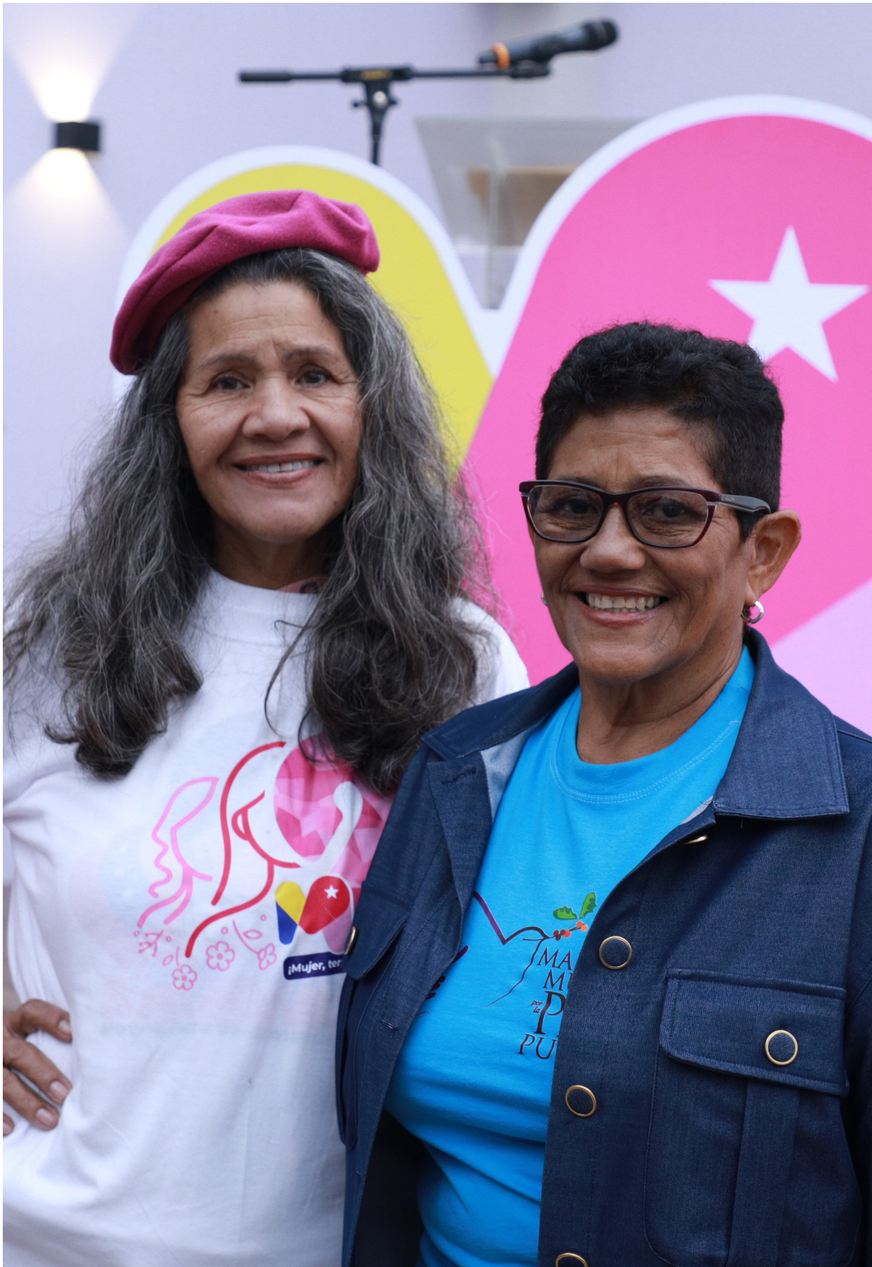
Ministra del Poder Popular para la Mujer